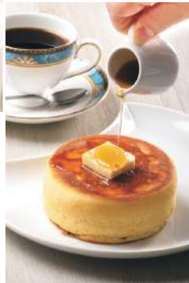
鉄板を使って低温でじっくり焼く、 厚くふっくらした「ホットケーキ」