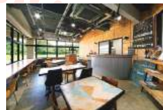
窓際カウンターがある店内は旧職員室を改装したもの