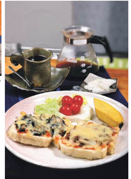
ひじきときんぴらとチーズの相性が絶妙な「ピザトーストセット」