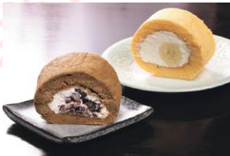
ふんわりしたロールケーキ2種(ほうじ茶のあずきクリーム、バナナ)