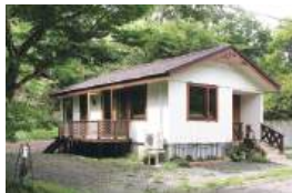
青根温泉サバトの森に佇む一軒家