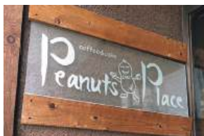
店名はスヌーピーが登場する漫画にちなんでいる