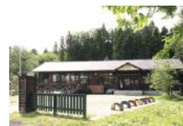
昭和初期の木造校舎を再現した建物