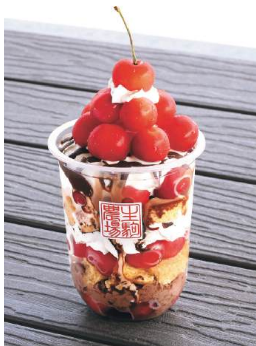
さくらんぼたっぷり!6月の「さくらんぼパフェ」