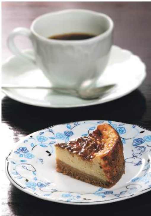
「Bセット」。濃厚で深い味わいバイクドチーズケーキとコーヒー「マイルド」