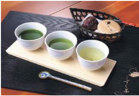
濃緑茶、嬉野茶、上煎茶の「飲み比べセット」と「しずく茶最中」