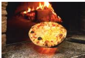
イタリアの石窯で熟練者が香ばしく焼き上げる