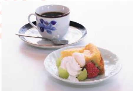
フルーツとクリームが添えられた日替わりケーキはコーヒーとセットで