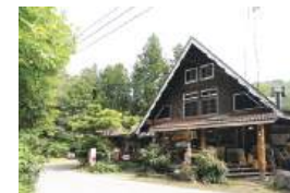
緑に囲まれた三角屋根のログハウス

川崎町大字今宿字焼橋沢山1 TEL.0224-84-4843 11:30~19:00(L.O.18:30) 火曜定休(火曜祝日の場合営業) 不定休あり