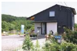
空と緑、草花が迎えてくれるカフェ

ガーデン カフェ ソラ 川崎町大字川内字朴ノ木山1-1 TEL.090-7832-0833 10:30~16:30 水・木曜定休 ※定休日でも3名以上は予約可 (11:00~15:00、ランチのみ)