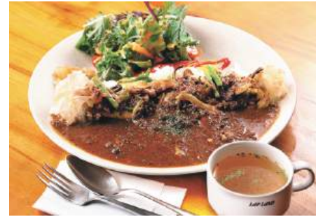
ワインで蒸したキノコと季節の山菜が豊富な「山賊カレー」