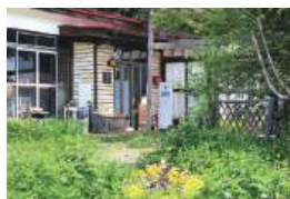
物語のプロログのような趣ある外観

川崎町大字川内字佐山11-1 TEL.0224-88-9019 月・木・金曜 10:00~17:00 土・日曜 12:00~17:00 ランチ 土・日・月曜 12:00~14:00 ※限定6食 火・水曜定休