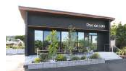
国道286号沿いにある黒壁のモダンな外観