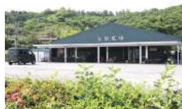
屋根付きのイトインスペースも設置

川崎町大字小野字弁天29-1 TEL.0224-87-6623 9:00~17:00 テイクアウトは10:00~16:00 火・水曜はテイクアウトのみ休み ※冬期(12月中旬~2月末ごろ)休業