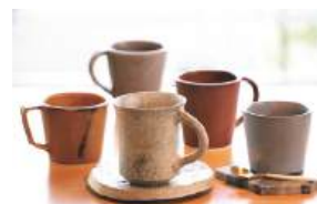
一点ものの器で 味わうコーヒー