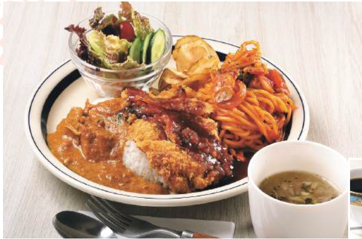
好きなパスタが選べる お楽しみプレート「カフェ マル風トルコライス」