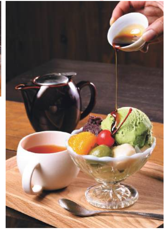
自家製あんこと自家製白玉を使った「白玉クリームあんみつ」