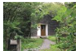
森の中の倉庫をイメージした建物