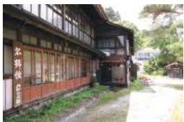
名旅館の歴史と面影を伝える建物

みょうごう ヒュッグ 川崎町青根温泉4-4 TEL.0224-86-4553 木・金・土曜 11:00~19:00 日曜 11:00~17:00 月・火・水曜定休