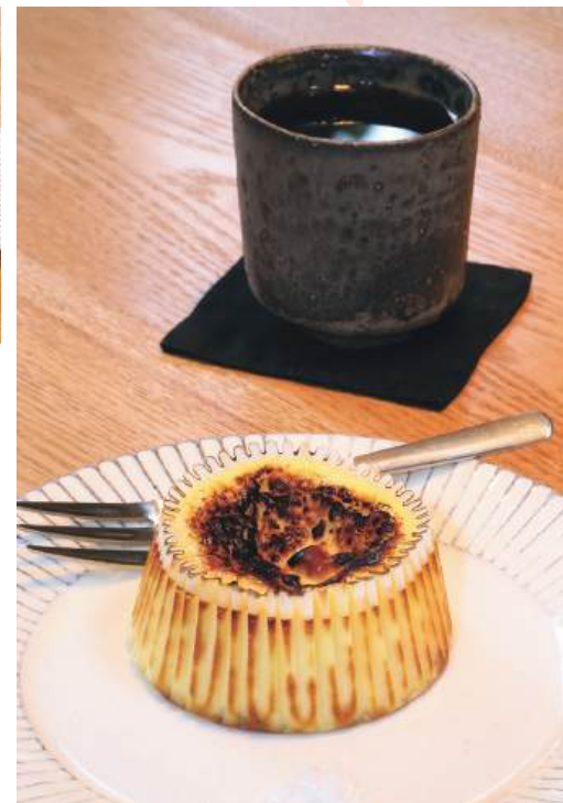
なめらかで濃厚な味の「バスクチーズケーキ」と「ブルーマーカー」