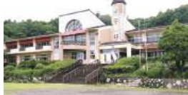
旧支倉小学校校舎を再生利用した可 愛い建物

川崎町大字支倉字塩沢9 (イーレ!はせくら王国) TEL.0224-51-9131 月～金、日曜 10:00～18:00 土曜 10:00～21:00(L.O.20:00) 火曜定休 ※火曜が祝日の場合は翌日休