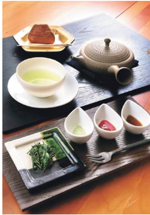
「本日の温かい上煎茶」。飲んだ後に茶葉を食べると、お茶の旨味をより味わえる