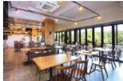
温かみのある店内。テラス席は ベット連れOK