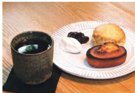
素材の良さが味わえるフィナンシェとしっとりしたスコーン