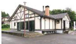
英国チューダー様式の外観が印象的

川崎町大字前川字北原22-9 TEL.0224-85-1656 11:00~16:00(L.O.15:30) ※パンの販売は9:00~ 売り切れ次第終了 土・日曜・祝日定休