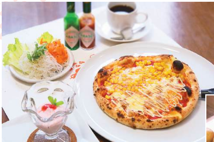
リーズナブルな「ピザランチセットA」。具材はツナマヨ&コン