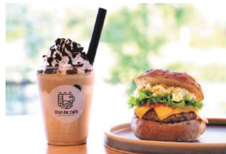
川崎町産の卵を使用した「背徳感のチーズ&ハンバーグエッグ サンド」と「ツネナガシェイク」