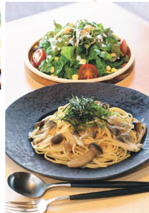
「和風しょうゆきのご pasta と季節のサラダセット」。サラダには自家栽培した 野菜を使う