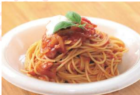
「ポモドーロ」に蔵王モツァオのモツアレチーズをのせて