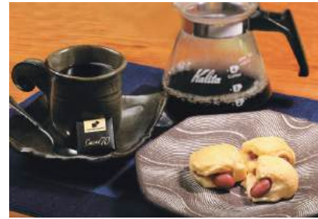
「伊達ブラックふれんど」。タイミングがよければ焼き菓子が付くことも