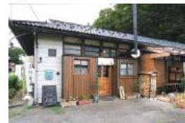
お茶屋さんの風情漂う平屋の一軒家