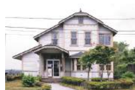
名旅館の歴史と面影を伝える建物