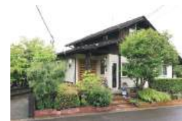
草木や菜園、自作の看板にほっこり

川崎町支倉台1-19-14 TEL.090-2980-1905 9:00～16:00 不定休