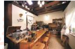
木のカウンターや椅子は オーナーの手づくり