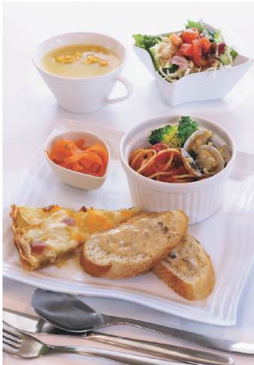
「キッシュとトマトソースパスタランチ」はドリンクとミニスイーツがセットで付く