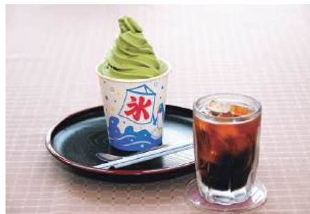
大自然が育んだおいしい水で作ったかき氷にアイスのをせて