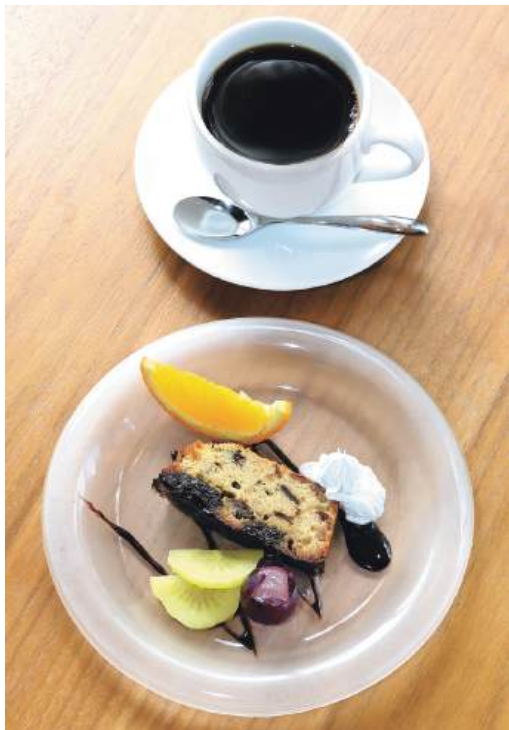
蔵王食工房 アトリエデリスの「ブリュー」と「ブレンドコーヒー」