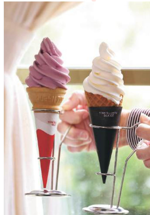
北海道産生クリーム100%の「プレミアムバニラ(400円)」と「巨峰(350円)」のソフトクリーム