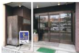
可愛いピーナッツのロゴと木製の樽が目印

川崎町大字前川字裏丁189-3 TEL.0224-84-2526 13:00~18:30 火曜定休 ※日曜不定休