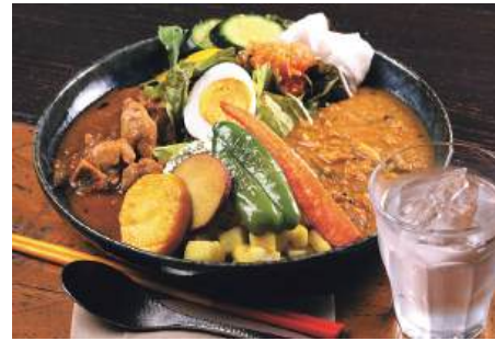
豆カレーとチキンカレー両方が味わえる「スパイスカレーあいがけ」