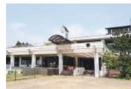
懐かしい学校の雰囲気が漂う建物

カワウチ カフェ 川崎町大字川内字天神前257-1 (旧川内小学校) TEL.0224-87-8727 11:00~17:00(L.O.16:30) 月・金曜定休 ※ドッグパークは10:00~