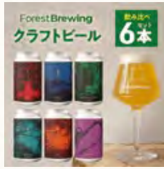
クラフトビール飲み比べ 6本セット 330ml × 各1本