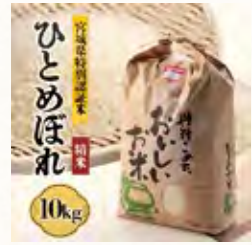
宮城県川崎町産 ひとめぼれ (精米) 10kg