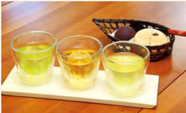
日替わり3種の「飲み比べセット(冷)」と老舗菓子店に特注した最中(選べるお菓子付き1,000円)