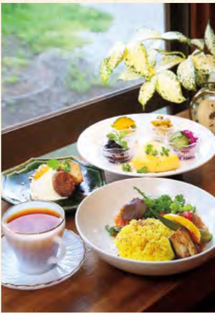
地産地消の食材を使い手づくりのおいしさにこだわったランチ「たけし豚のミートボールトマト煮込み夏野菜のマリネ添え」(1,600円)

川崎町川内佐山11-1 TEL 0224-88-9019 月・木・金10:00～17:00 土・日12:00～17:00 ランチ 土・日・月12:00～14:00 ※限定6食 火・水曜定休