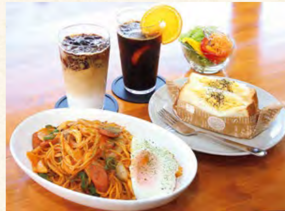
「昔ながらのナポリタン」(800円)、「ふわふわたまごサンド」(600円)、「本格コーヒーゼリー」(600円)、「オレンジジュース」(650円)

川崎町川内天神前257-1(旧川内小学校) TEL 0224-87-8727 10:00～17:00(L.O.16:30) 月・金曜定休