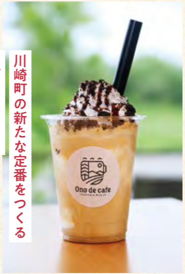
川崎町の新たな定番をつくる モダンなカフェ

右上/緑や花を見ながらリラックスできるガラス張りの明るい店内 右下/石窯で焼いたライ麦パン、自家栽培野菜を使った川崎町産たまごサンド(単品650円) 左/エスプレッソにホイップクリーム、チョコクッキーのコラボ「ツネナガシイク」(780円)