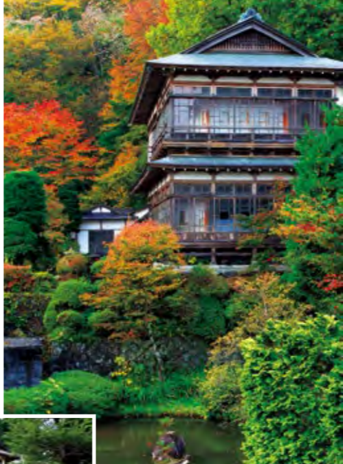
上／青根御殿。江戸時代以降の多くの展示品や資料を見られる(宿泊者限定)