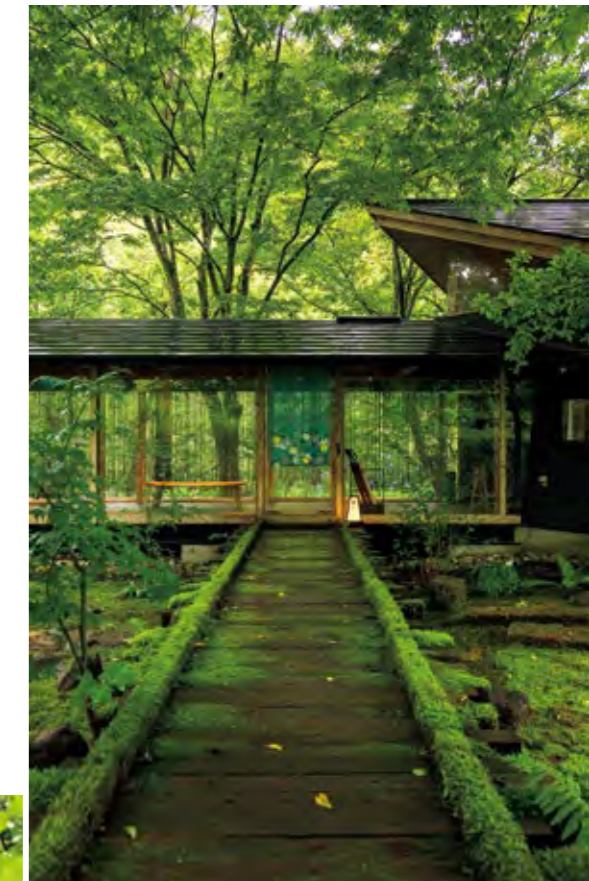
苔むした木道に誘われて入り口へ

川崎町本砂金板原18 詳細についてはHPをご覧ください https://ykn.co.jp/