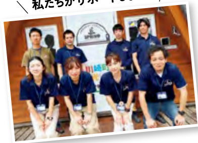
川崎町地域おこし協力隊

移住の相談 & 情報収集なら みやぎ川崎SPRING 自然豊かな川崎町で暮らしたいけど、住まいは? 仕事は? 生活施設は? 近所との付き合いはどんな感じ? そんな移住についての不安を解消してくれるのが、気軽に相談や情報収集ができる「みやぎ川崎SPRING」だ。スタッフは、移住経験者の地域おこし協力隊。経験者ならではの提案や親身なサポートをしてくれる。川崎町には空き家バンクをはじめ住宅取得や子育て、医療など様々な補助金・支援制度が揃っているため、相談しながら、自分らしい暮らし方を実現したい。