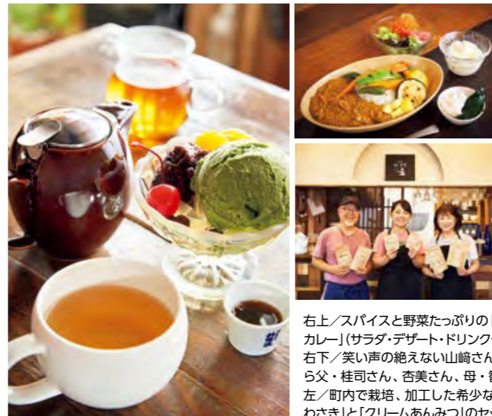
右上/スパイスと野菜たっぷりの「スパイス豆カレー」(サラダ・デザート・ドリンク付き913円) 右下/笑い声の絶えない山崎さん家族。左から父・桂司さん、杏美さん、母・智子さん 左/町内で栽培、加工した希少な「和紅茶かわさき」と「クリームあんみつ」のセット(715円)

川崎町前川字裏丁81-1 TEL090-8053-1223 11:00～17:00 日・月・火・水曜定休