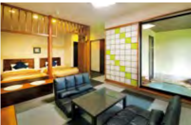
上/四季折々の景色につつまれて湯にひたる心地よさは格別 下/客室は、和モダンデザインのスイートルーム。半露天風呂と露天風呂、2つの風呂がある部屋も。建物から半円形に張り出したラウンジはもう一つの憩いの場になる